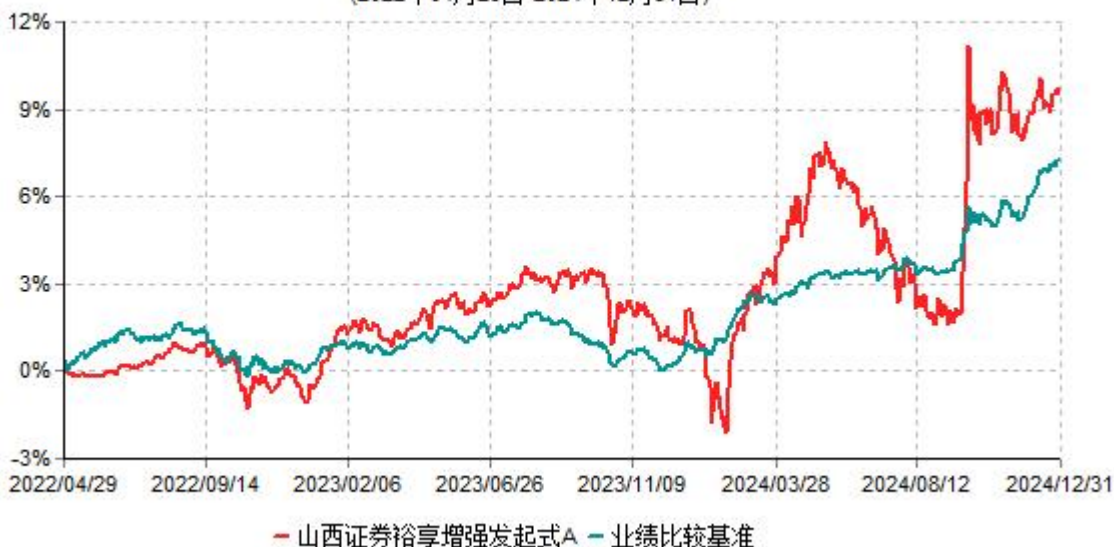
山西证券裕享增强发起式A累计净值增长率与业绩比较基准收益率历史走势对比图 (2022年04月29日-2024年12月31日)